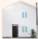
シンプルモダン ヤネ