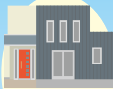
おしゃれな デザイナーズ ハウス