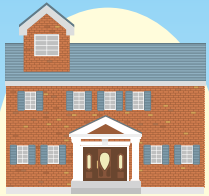
あこがれの 輸入住宅